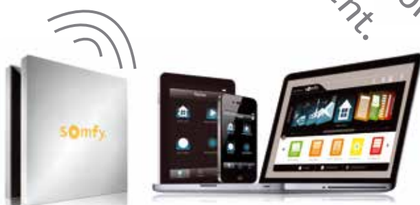
TaHoma® box + bediening via internet

Home Motion. Uw hele huis onder controle. Waar u ook bent.